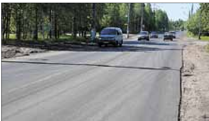
■ Улица Кировская

раз улицы, ведущие в округ, были отремонтированы в 2006 году. С тех пор большегрузный транспорт с лесом привел дороги в негодность.