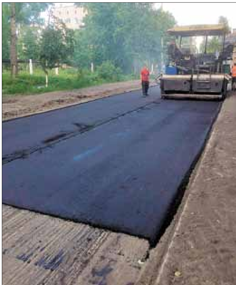
■ В Архангельске ремонтируют проезд Сибиряковцев

Ситуацию было призвано исправить создание дорожных фондов. Однако на деле распределение средств из областного дорожного фонда оказалось не в пользу Архангельска: в прошлом году город получил на ремонт дорог только 76 миллионов рублей, в этом – 97 миллионов. При этом архангелогородцы вносят в региональный дорожный фонд порядка 1,2 миллиарда рублей. Поэтому и для городских властей, и для жителей Архангельска вопрос об увеличении фи-