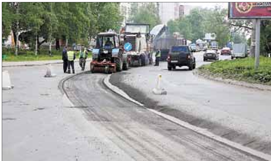
■ Улицу Тимме ремонтируют от Воскресенской до улицы Урицкого

Въезд в Северный округ – один из самых оживленных дорожных участков. Последний